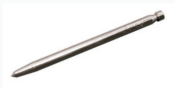
Riscador de azulejo encartelado

Ferramenta simples para riscar e marcar rapidamente. Feito de aço carbono com ponta de metal duro. Posicione o riscador no local desejado e pressione levemente para fazer o corte ou marcação.