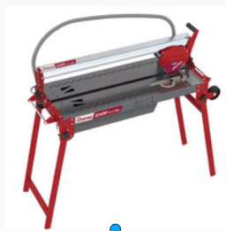
Cortador de bancada ZAPP 900 FIT

Indicada para cortes retos em porcelanatos, cerâmicas, mármore e pedras naturais. Possui motor potente e permite cortes rápidos e precisos. Posicione a lâmina no local de corte e acione o gatilho.