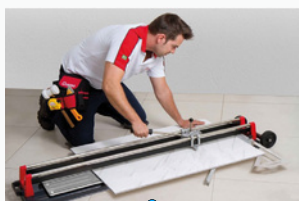
Riscador de azulejo encartelado